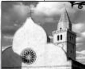
Muggia - Milje Nuova Filiale Nova Podružnica