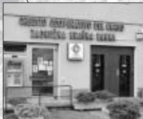
Domio - Domjo