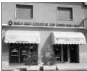
Sistiana - Sesljan