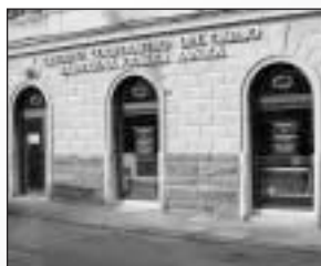
Trieste - Trst Via/UI. Molino a Vento, 154