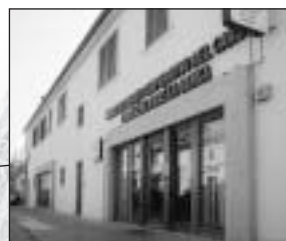
Basovizza - Bazovica