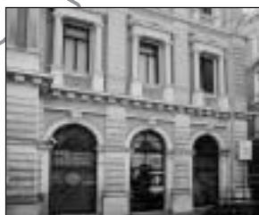
Trieste - Trst Piazza /Trg Libertà, 5