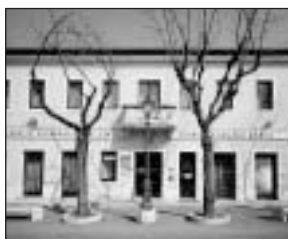
Aurisina - Nabrežina